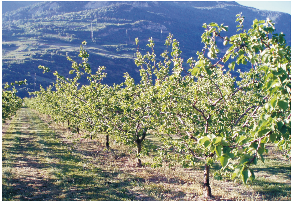
Abb. 2: Beispiel der intensiven Obstplantagen als Nahrungshabitat von Wendehälsen

wir, ob die Witterung zur Brutzeit einen grossen Einfluss auf den Bruterfolg und das Wachstum der Nestlinge hat. Es zeigte sich, dass Wetterschwankungen nur einen begrenzten Einfluss auf das Wachstum von Wendehalsnestlingen ausüben (GEISER et al. 2008). Die Nestlinge werden bei schlechtem Wetter weniger gefüttert und wachsen langsamer, doch können sie in Schönwetterphasen diesen Verlust meist wieder aufholen, so dass letztlich die Nestlingsmortalität wenig vom Wetter abhängt.